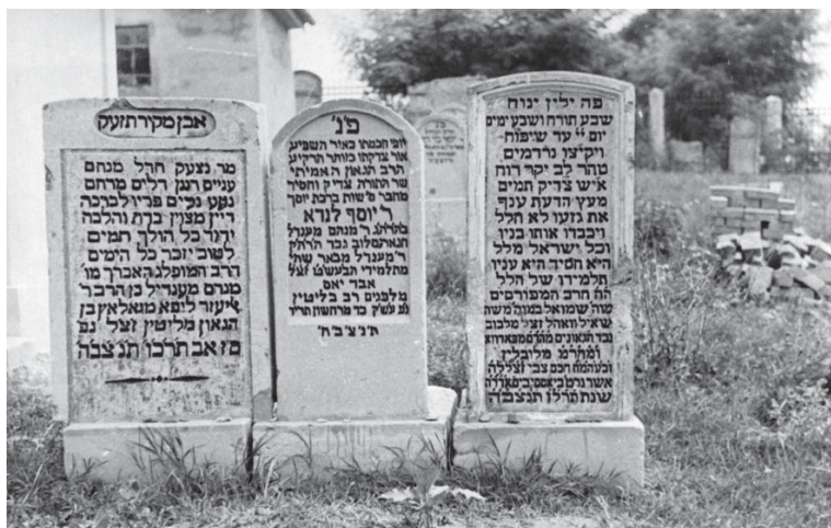
Mormintele a trei rabini strămutați din cimitirul vechi în cel din Păcurari, Iași Tombs of three rabbis, that were moved from the old cemetery to the cemetery of Păcurari, Iași