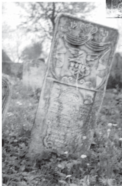
Piatră funerară, cimitirul evreiesc din Mihăileni, 1876 Funeral stone, the Jewish cemetery from Mihăileni, 1876