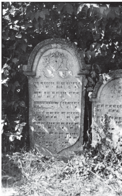
Pietre funerare vechi, cimitirul evreiesc din Braşov (1) Old tombstones, the Jewish cemetery from Braşov (1)