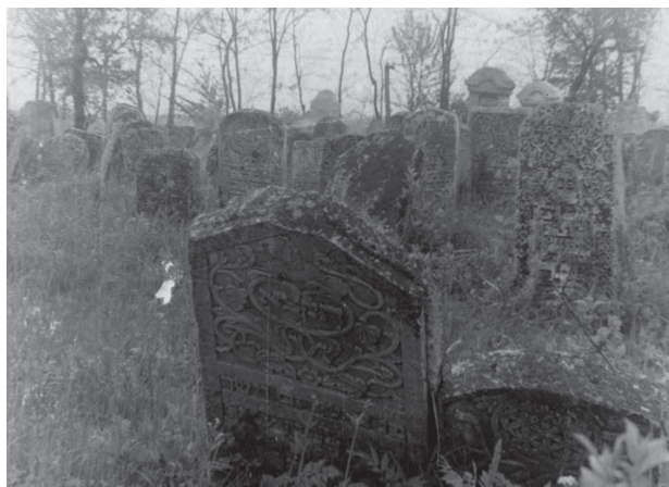
Mihăileni, cimitirul evreiesc vechi Mihăileni, the old Jewish cemetery