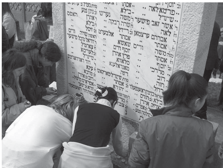
locuri în care tăcerea înseamnă respect, iar lumina aducere aminte - Sarmaș places where silence means respect, and light means remembrance