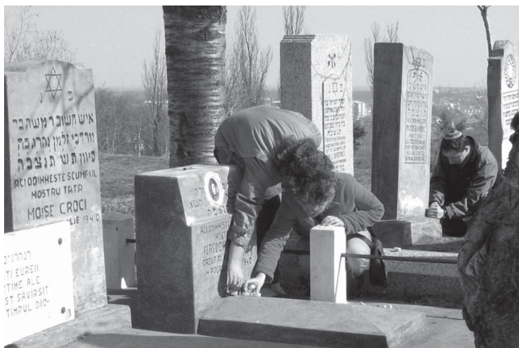
tineri evrei respectând memoria celor morți Young Jews keeping the memory of the departed