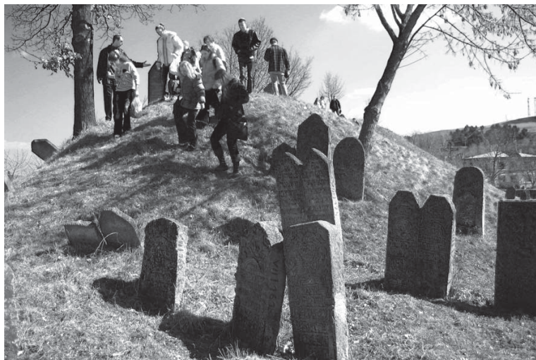
Cimitirul din Siret The cemetery from Siret