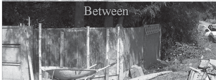
Gardul de împrejmuire se repară, se curăță locul de vegetația abundentă - Cimitirul Rădăuți The enclosing fence is being repaired and the whole place is being cleansed from the abundant weeds