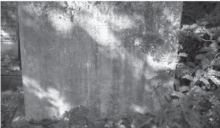
Piatră tombală pe care numele abia se poate citi, semn că a trecut multă vreme – Cimitirul Rădăuți A tombstone on which the name is barely readable, meaning that a long time has passed since the burial