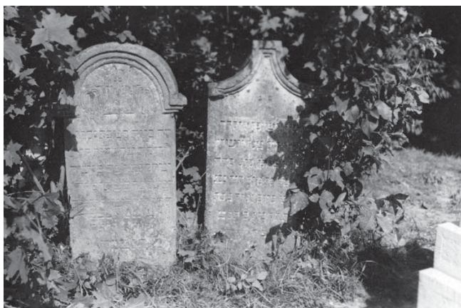
Pietre funerare vechi, cimitirul evreiesc din Brașov Old funeral stones, the Jewish cemetery from Brașov