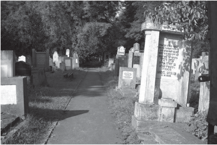
Parcela 1 a cimitirului – loc curat, îngrijit, semn că există interes și preocupare pentru prezervarea patrimoniului sacru al evreilor – Cimitirul Rădăuți Plot 1 of the cemetery – a clean and nice place, meaning that there is interest and concern for the preservation of the sacred patrimony of the Jews