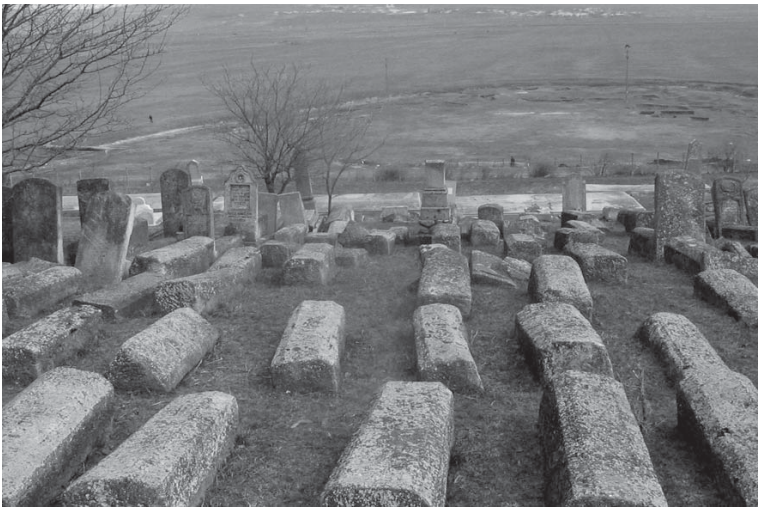
Cimitirul evreiesc din Tg. Frumos The Jewish cemetery from Tg. Frumos