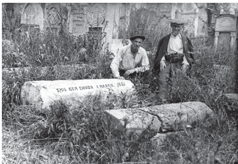
Primul mormânt din cimitirul din Păcurari, Iași The first tomb from the cemetery of Păcurari, Iași