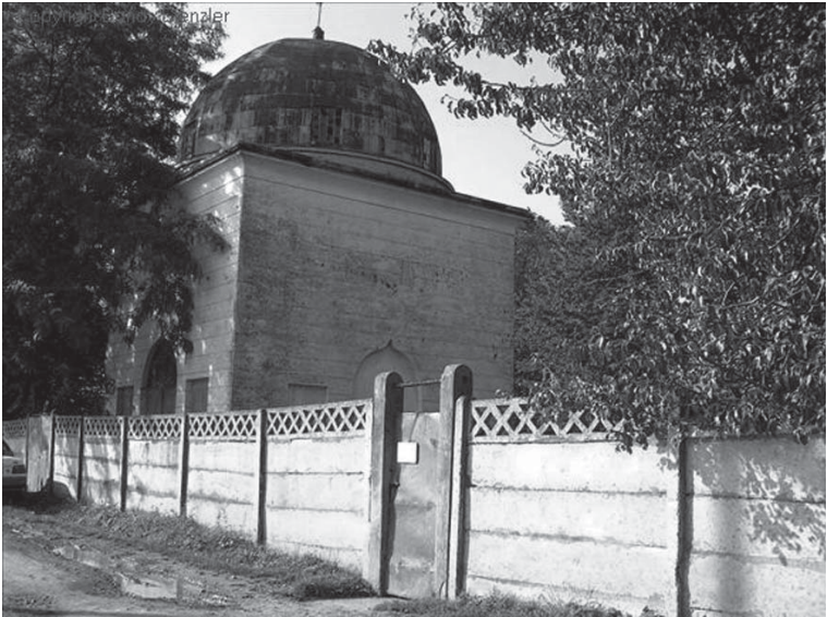
Intrarea în cimitir – Cimitirul Rădăuți Entrance to the cemetery