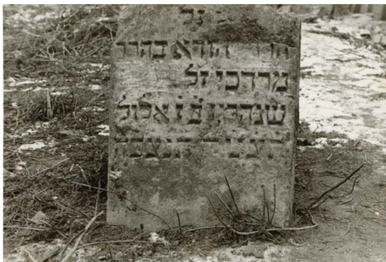
Iehuda sin Mordehai, ucis în sept. 1709, Cimitirul vechi Botoșani Iehuda sin Mordehai, killed in Sept. 1709, the old Jewish cemetery from Botoșani