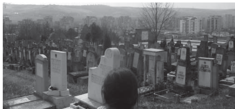
Podu Iloaiei, județul Iași – gropi comune Podu Iloaiei, Iași County – common graves