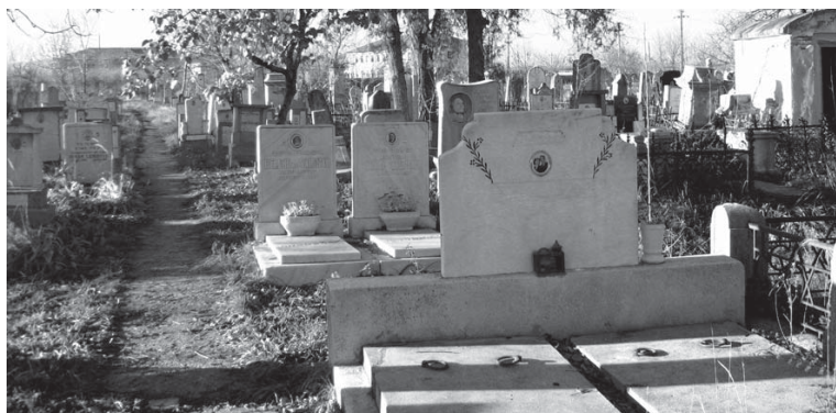
Aleile din cimitir – drumuri pe care, unii dintre noi, ne-am condus pentru ultima dată părinții, prietenii... Cimitirul Râmnicu Sărat The alleys of the cemetery – paths on which some of us went for the last time together with our parents and friends...