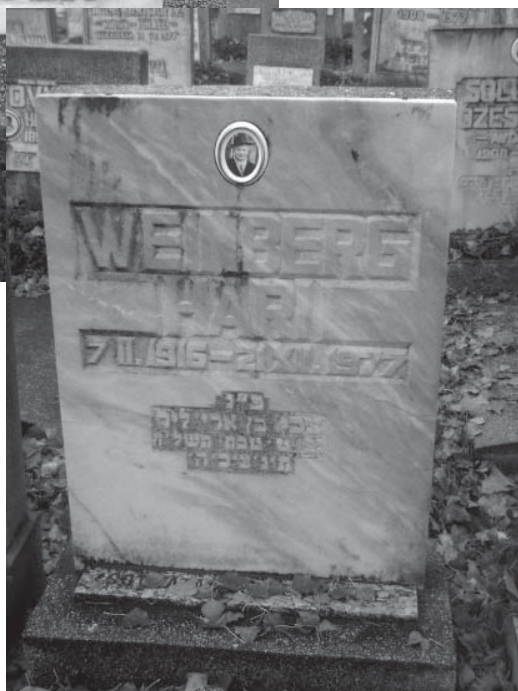
Cimitirul evreiesc din șoseaua Giurgiului, București The Jewish cemetery from Giurgiului Road, Bucharest